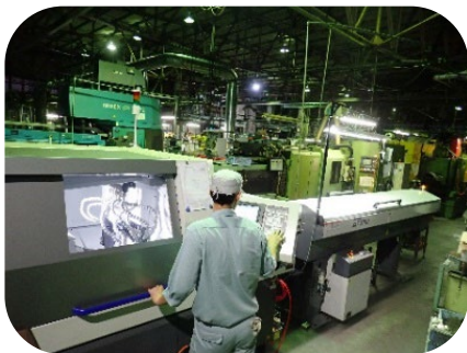
設備例 1. 主軸台移動型CNC自動旋盤