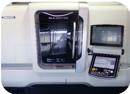
設備例 2. NC旋盤 (NLX2000)